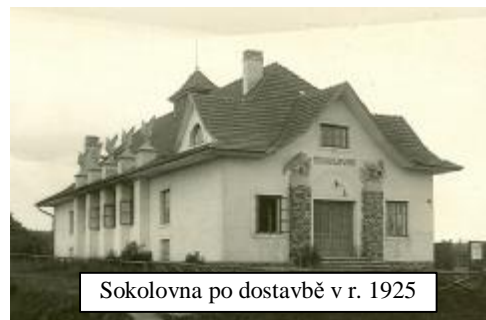
Sokolovna po dostavbě v r. 1925