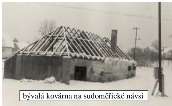
bývalá kovárna na sudoměřické návsi

A teď co se dělo v obci. Upravovala se návěs a stráž pod kostelem. Za účasti 92 občanů se ve dvou sobotních „národních“ směnách rozprostřelo 200 kubíků zeminy a travou oselo kolem 600 m 2 . Další směny byly ve dnech 9. a 16.10. Tehdy pracovalo 39 dospělých a 34 starších žáků z místní školy. V Sudoměřicích bylo ten rok položeno 200 běžných metrů obrubníků a 200m 2 chodníkové dlažby. V květnu se začala bourat stará kovárna na návsi. Zároveň se začala stavět nová prodejna Jednoty. Byl vyhlouben sklep a jímky a přeložena kanalizace potoka. Na stavbě Jednoty se spoluobčané zavázali odpracovat 2 000 hodin. Také se v tomto roce zahrnula odpadní jáma „hliník“ u Haškovců a položena byla v těch místech kanalizace. V listopadu už stála hrubá stavba prodejny.