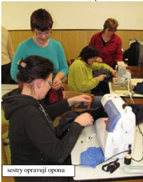
sestry opravují oponu

Nově se u nás rozběhla pravidelná hodina populární zumby.