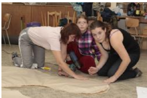
Vše začalo lepením balónů ve školní dílně.

Spolupráce s ZUŠ v Bechyni, místními spoluobčany, spoluobčany z Bechyně a pochopitelně -Tatrmany ze Sutoměřic, Plzně a Brna.