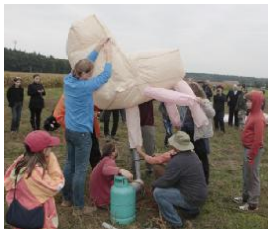
Odpoledne na louce létali houby, ryby, židle, kornouty se zmrzlinou, toaletní papír, lebky a jiné