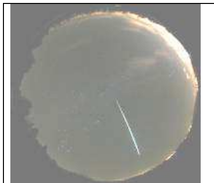
Obrázek 1: Celooblohový snímek bolidu z 18. ledna 2018 pořízeného automatickou digitální kamerou umístěnou v Astronomickém ústavu AV ČR v Ondřejově.

Astronomický ústav AV ČR oznámil, že ve čtvrtek 18. 1. 2018 „vstoupil do zemské atmosféry meteoroid o hmotnosti přibližně 3 kilogramy. Těleso se na začátku pohybovalo rychlostí přesně 20 km/s. Během letu se prakticky celá jeho hmota spotřebovala, nicméně pravděpodobně 1 – 2 menší meteority o hmotnosti kolem 100 g a několik výrazně menších, mohly dopadnout na zemský povrch. Z dostupných dat pádová oblast pro největší 100 g meteority vychází přibližně 2 – 3 km východně od centra Bechyně, tedy v oblasti mezi Bechyní a Sudoměřicemi u Bechyně.“ ( http://www.asu.cas.cz/articles/1325/19/jasny-bolid-nad-jihozapadnimi-zechami-podrobne-zachyceny-kamerami-ceske-casti-evropske-bolidove-site-18-ledna-2018 )