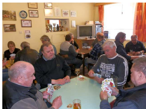
Seskupení mariášníků Bežerovice

Za zdárný průběh soutěže patří poděkování obci Sudoměřice u Bechyně a zemědělskému družstvo Rosa Sudoměřice, s. r. o. Dík patří i dalším sponzorům a všem, kteří se podíleli na přípravě akce a na občerstvení pro účastníky.