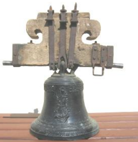
Původní zvonek z roku 1768

Původní zvonek bude opraven a nakonzervován a po té bude vystaven v prostorách Obecního úřadu v Sudoměřicích.