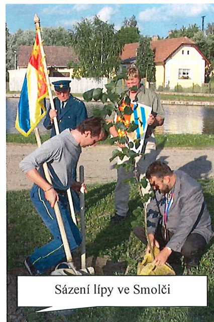
Sázení lípy ve Smolči