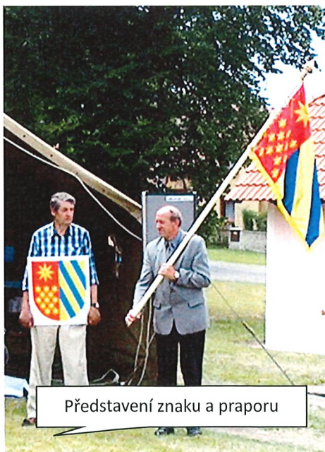
Představení znaku a praporu