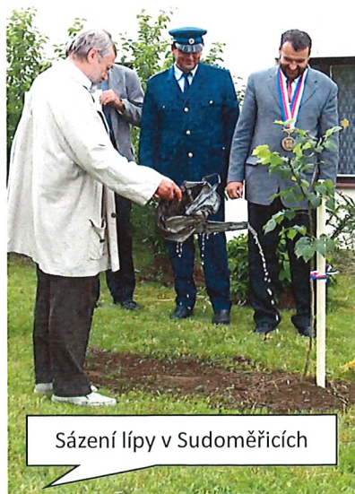
Sázení lípy v Sudoměřicích