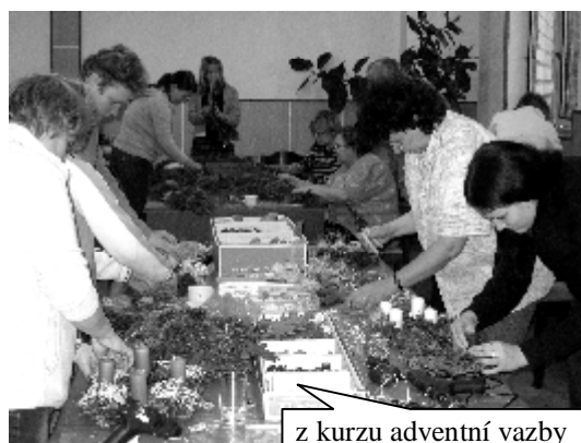
z kurzu adventní vazby