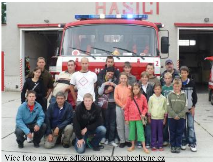
Více foto na www.sdhsudomericeubechyne.cz

Věřím, že se tábor všem líbil a tímto bych chtěl poděkovat všem vedoucím, dále obci Sudoměřice za půjčení auta a dalším lidem, kteří nám pomohli tento pobyt uskutečnit.