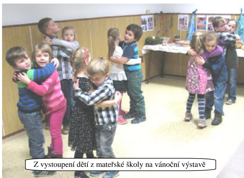
Z vystoupení dětí z mateřské školy na vánoční výstavě