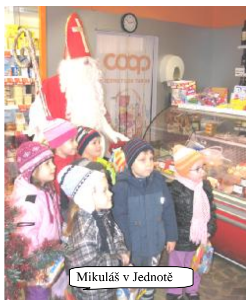
Mikuláš v Jednotě