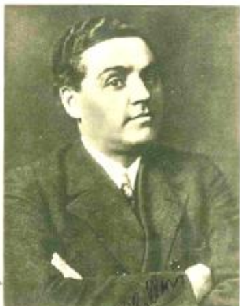
DR. K. H. HILAR ~ REŽISÉR NÁRODNÍHO DIVADLA V PRAZE 1885-1935